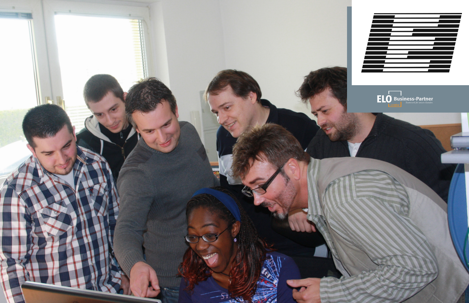
A.S.E. Das Team

ELO Business-Partner Teamwork for innovative solutions